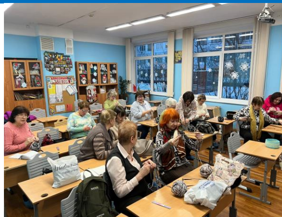
Участие в благотворительной акции «Поделись теплом»