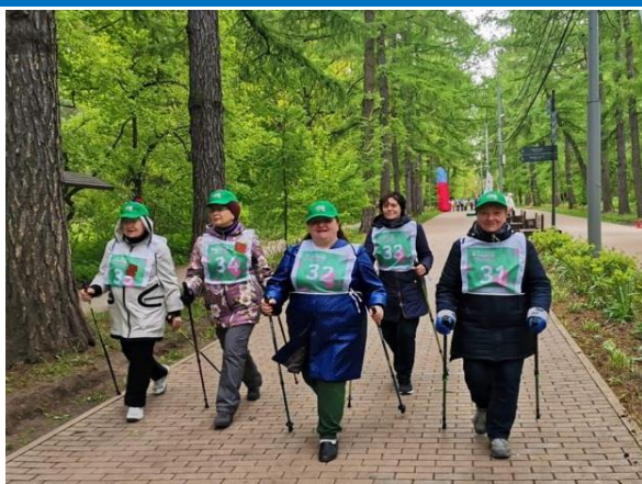
Участие в массовом заходе по скандинавской ходьбе