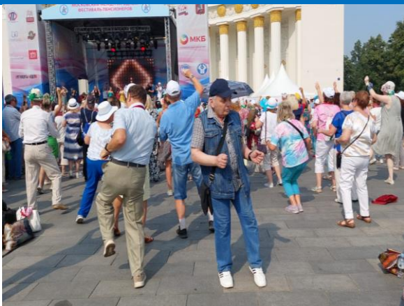
Участие в установке рекорда «Самое массовое исполнение твиста танцорами 55+»