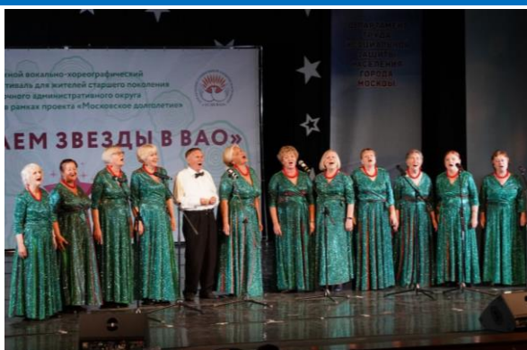
«Зажигаем звезды ВАО»